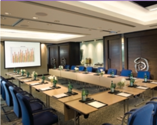
■ 聚賢廳 II 及 III