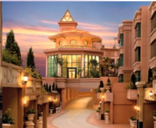
■ 座落於港島南區的尊貴府邸