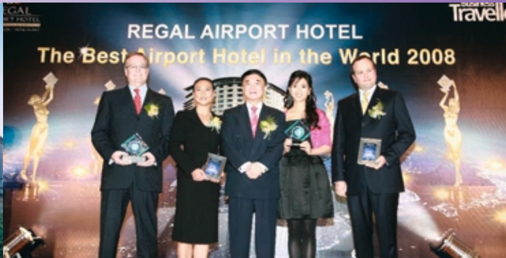
■ 全球最佳機場酒店（二零零八年）