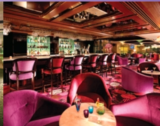
■ Basso Bar