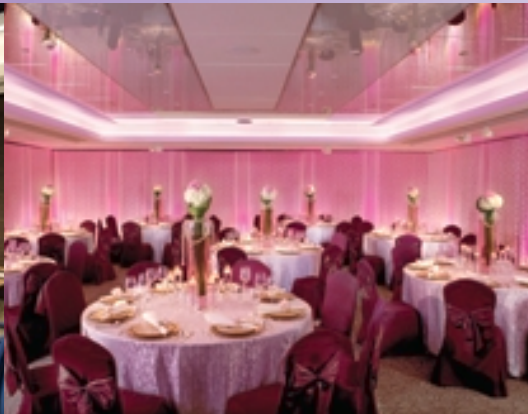
■ 聚賢廳 I