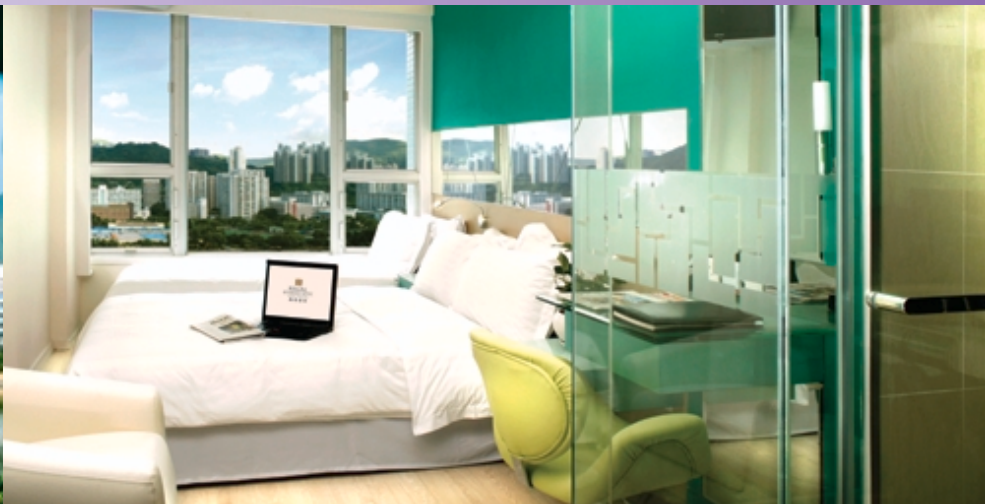
■ 富豪 i-Club 客房