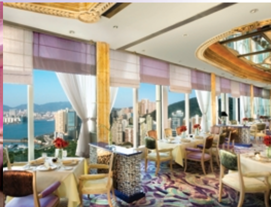
■ Zeffirino 風情畫意大利餐廳