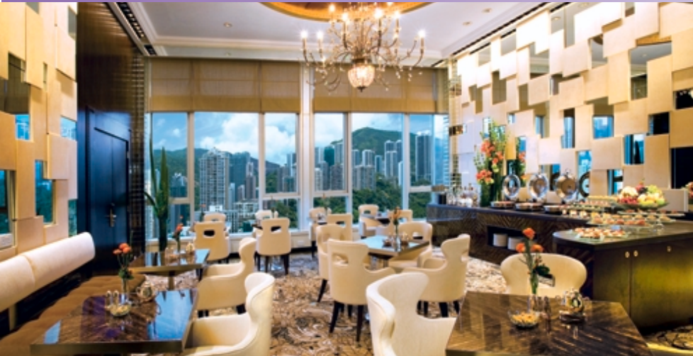
■ 御富豪行政樓層專用休憩室