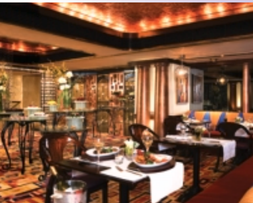
■ Mezzo Grill